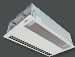
Harmony® Finesse encastrable