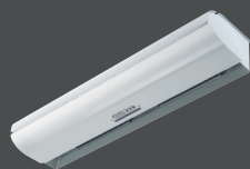
Harmony® One Evo monophasé