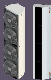
Indussy® 2 Industrie