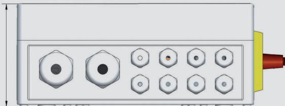
Ordinys DS - 1 V avec ou sans interrupteur et pressostat